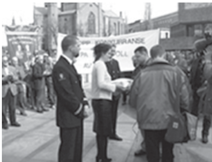
Overlevering til Brustad