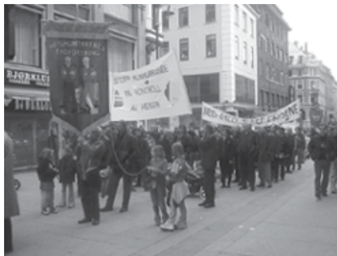
Fra 1. mai toget

Vi nordmenn er opptatt av personvern, og stoler ikke på bedrifter som registrerer oss. Likevel gir vi gjerne fra oss både navn, alder og adresse til de samme bedriftene.