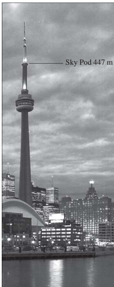
CNT by night (Sky Pod 447 m)

Den opprinnelige hensikten med bygget var å skape en turistattraksjon, og et nasjonalt ikon. «CN» står for Canadian National, byggherren, som ville demonstrere kanadisk industris evner ved å bygge tårnet høyere enn noe annet i verden. Ulikt andre høybygg jobber derfor få personer der – ”bare” 600-800 personer. Og en turistmagnet har det blitt. Mer enn 2 mill. besøkende per år regner man med, på enkelte dager mer enn 75 000. I tillegg anvendes tårnet som TV- og kommunikasjonsmast. Det sies at folk i Toronto og de omkringliggende byene har den beste mottakerkvaliteten på hele det nordamerikanske kontinent. Bygget feirer 25-årsjubileum praktisk talt i opprinnelig stand, bare med utvendig overflatebehandling og delvis modernisering av heisstolene.