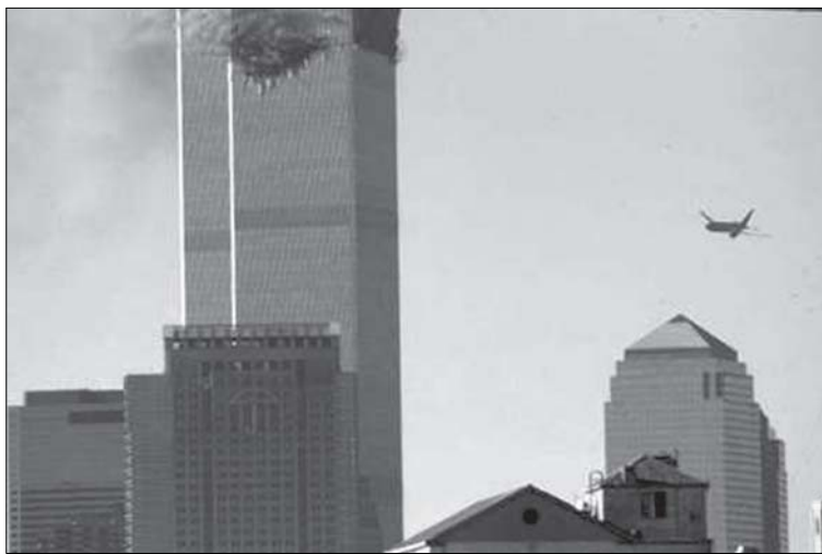
Fra «ulykken» i World Trade Center (USA)

900/ Swift Futura's. We heard a loud explosion and turned to see the north tower with a gaping hole in it, flames and smoke spewing out. We had no idea at that time what was going on . . . only speculation. After a few minutes, there were about seven helicopters hovering in the vicinity. In the distance, south and to the west (there were about 100 people on the rooftop now) we saw a plane heading towards the WTC. We thought it was a military plane coming to assess the