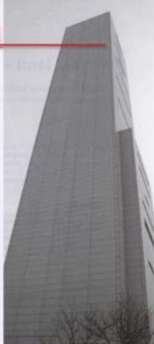
Testårnet til Otis.

Kombinasjoner av pulserende krefter, elastisitet og svingninger i høye bygg kan gi situasjoner som har direkte innflytelse på sikkerheten til heisen. Det ble her vist eksempler på hvordan elastisitet i bæretau og oppheng kan gi kortvarige svingninger som overskrider det som normalt