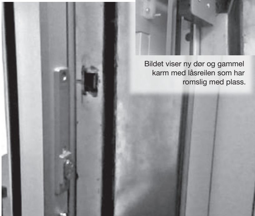
Bildet viser ny dør og gammel karm med låsreilen som har romslig med plass.

Vi stengte heisen og den gamle døra blei fiska opp fra containeren og montert inn igjen. ▲▼