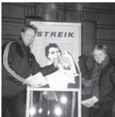
Bildet her er fra Ullevål universitets-sykehus klokken 07.00 første streikedag i 2002.

av sitt arbeidsforhold (bolig). Frem til slutten av 40-årene var det slik at sykepleiere måtte slutte i yrket hvis de giftet seg. Diakonissene fikk som de siste først på 60-tallet anledning til å fortsette i jobb hvis de hadde familie. Forbundet fikk jobbet frem et forslag slik at Stortinget i 1960 vedtok Lov om pensjonsordning for sykepleiere. Det skjedde 7 år før vi fikk alminnelig folketrygd i Norge! Loven er vi i dag svært glad for med alle de endringene som skjer i helsesektoren. De første mennene i sykepleien ble utdannet på slutten av 40-årene. Andelen menn er i dag på ca 10 %. Lønnskampen for sykepleierne har vært og er tøff. Lønnsforholdene var slette. Vi hadde utsagn fra arbeidsgivere som at «sykepleierne skal få sin lønn i himmelen». Det ble fra en av våre pionerer møtt med: «Hvis sykepleierne ikke får mer lønn her på jorden, blir de så slemme at de ikke kommer til himmelen»