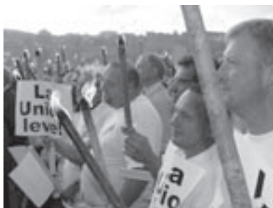
LA UNION LEVE