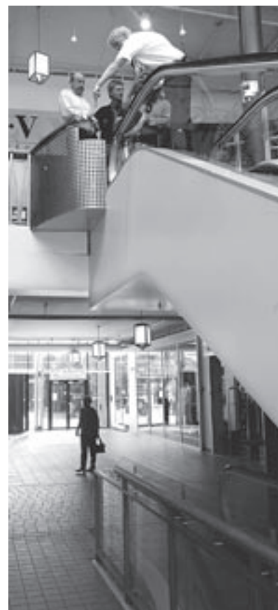
Rulletrappen (7b) undersøkes etter ulykken.